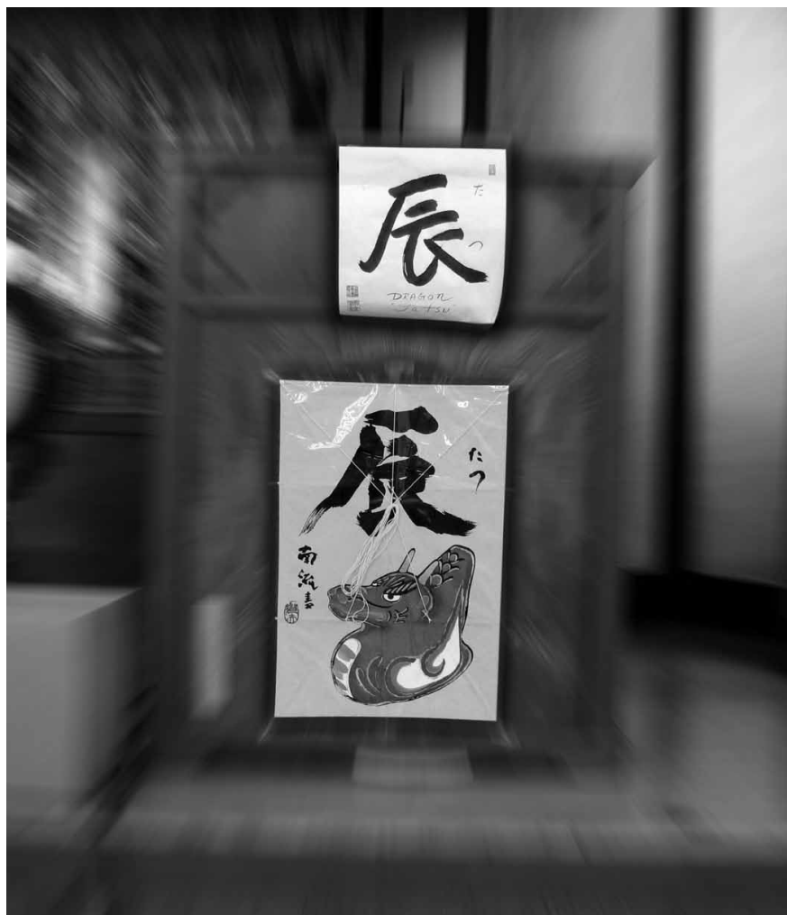
The podium is adorned with a drawing of a tatsu (dragon). 2012 is the Year of the Dragon, a year predicted to be filled good fortune.