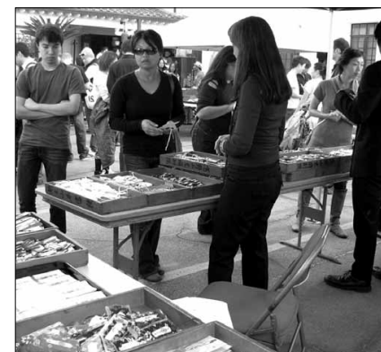
Thanks to Temple-goers who purchase omamori, omikuji (fortune) and ema for good luck in 2012, Koyasan makes record-breaking sales.