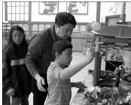
The ministers and the future generation of Koyasan offer sweet tea to the Baby Buddha. Center right photo shows the Baby Buddha altar at the Japanese Community Cultural Center garden, where the LACBF holds their Hanamatsuri Service in 2012.