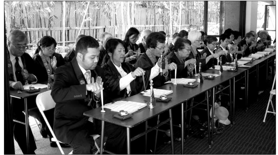
Members of the Eiyu-kai perform with the Zenshuji Goeika group at the LACBF Hanamatsuri Service held at the Japanese Community Cultural Center.