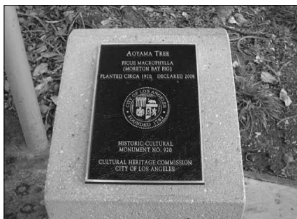
Plaque proclaiming the Aoyama Tree as a historic-cultural monument of Los Angeles.