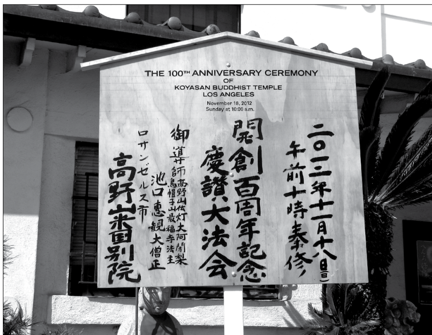
A sign post in the front courtyard heralds the important facts about the 100th Anniversary.