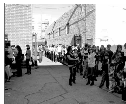
A long line of people wait to enter the temple for prayer and blessing.