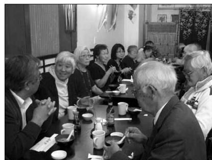
Members of the Temple enjoy lunch at Sansuitei.